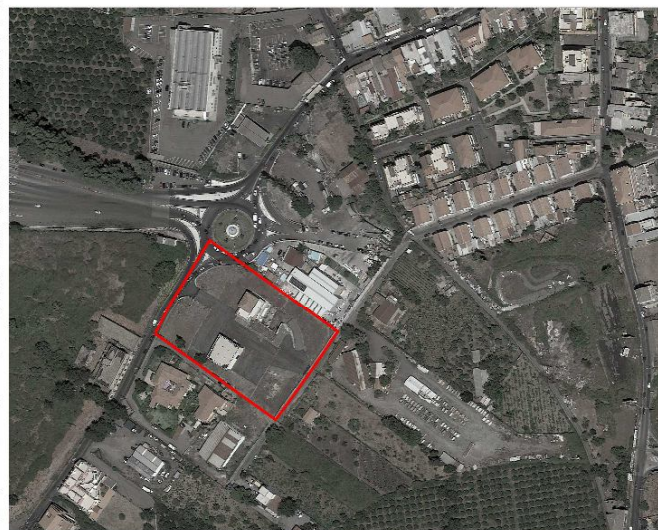
FOTO AEREA Maggio 2016

SCAUSTUDIO S.S. s.r.l. - Via Nazionale Centrale, 81 cap. 9526 Acireale (CT) tel. 095 370950250 scaustudio@www.scaustudio.it